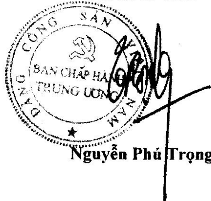
Nguyễn Phú Trọng